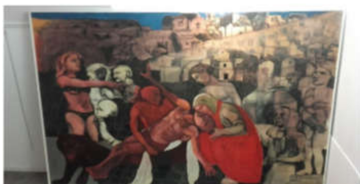
La Resurrezione di Lazzaro, 1974