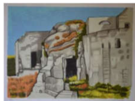
Senza titolo 1970